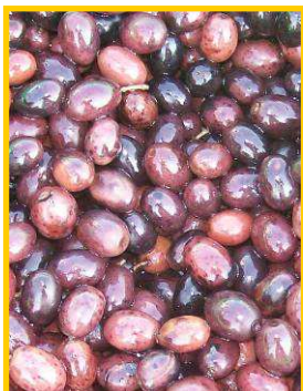
Olive Nere e Rosate